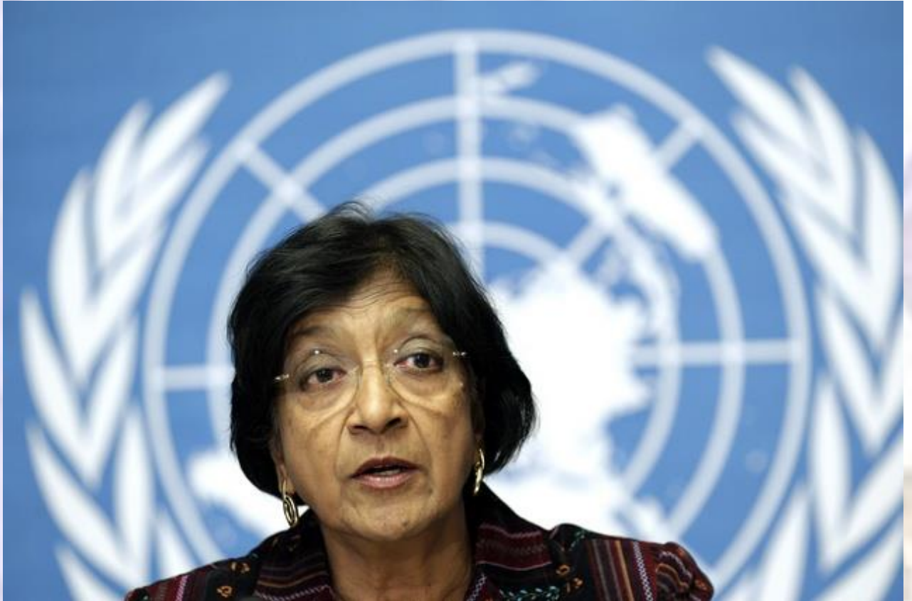
Palestina: La ONU pide que se levante bloqueo a Gaza y que cese la tortura