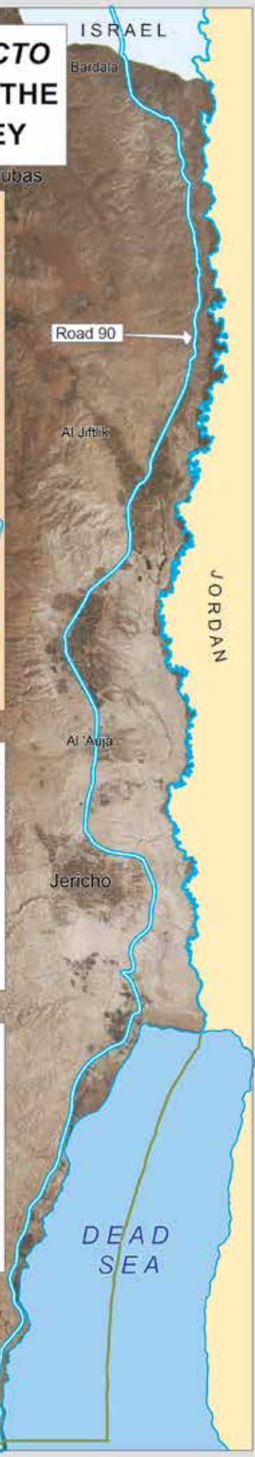
Exploitation of Palestinian Resources Water Extraction in the Jordan Valley